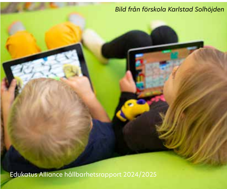
Bild från förskola Karlstad Solhöjden

Dialogen med våra intressenter ger viktiga insikter som hjälper oss att identifiera möjligheter och risker i vårt hållbarhetsarbete. Intressenternas inspel är också avgörande för vilka områden vi ska fokusera på, alltså vilka områden där vi kan göra störst skillnad. Den ligger också till grund för arbetet med väsentlighetsanalysen. Hur vi genomför dessa dialoger beskrivs i tabellform här intill.