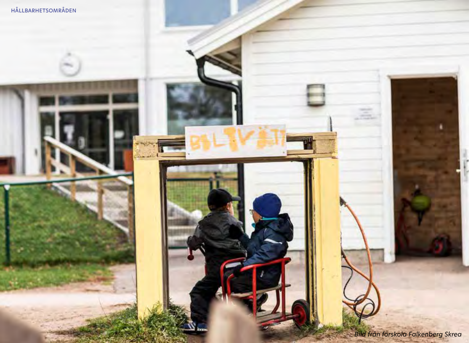
Bild från förskola Falkenberg Skrea

För att möta dessa risker har vi en resepolicy som tydligt prioriterar hållbara alternativ. Policyn innebär att tåg ska väljas framför flyg på inrikesresor, att kollektivtrafik ska vara förstahandsval för kortare resor och att digitala möten alltid ska övervägas innan fysiska resor bokas. Vi ser redan nu att digitala möten har blivit ett naturligt inslag i vår vardag, vilket minskat resandet och sparar både tid och utsläpp.